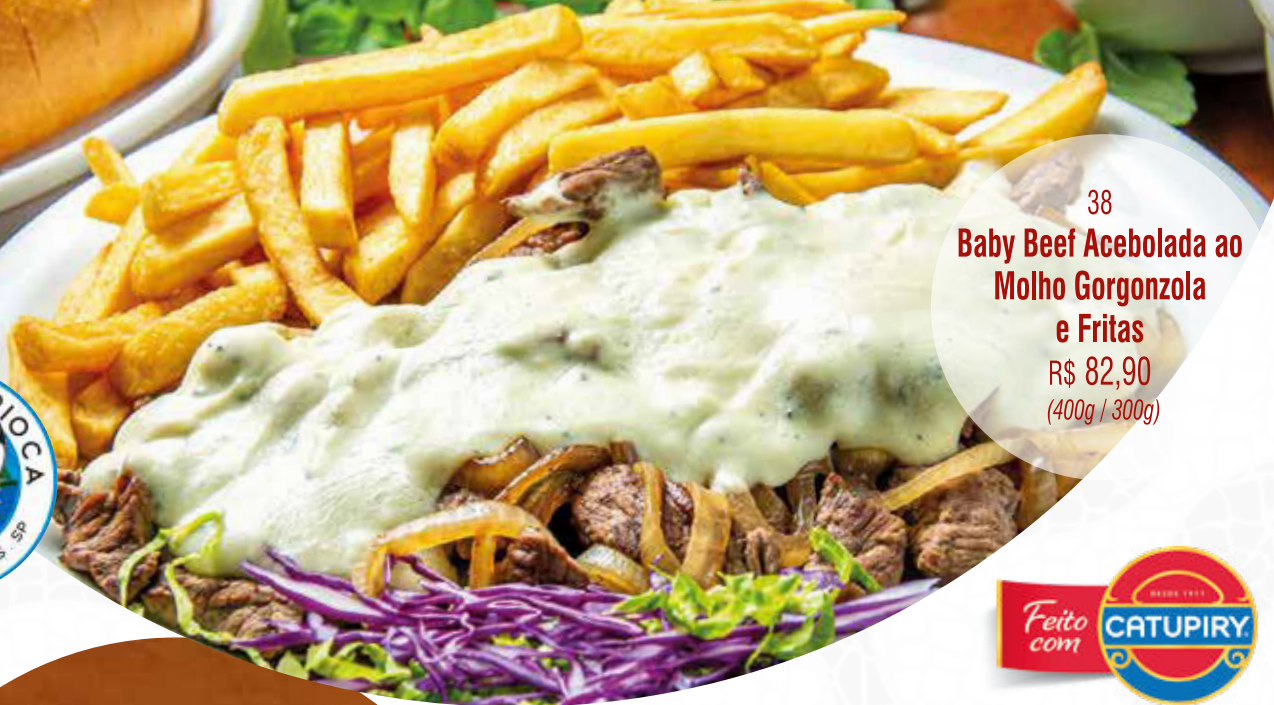
38 Baby Beef Acebolada ao Molho Gorgonzola e Fritas R$ 82,90 (400g / 300g)