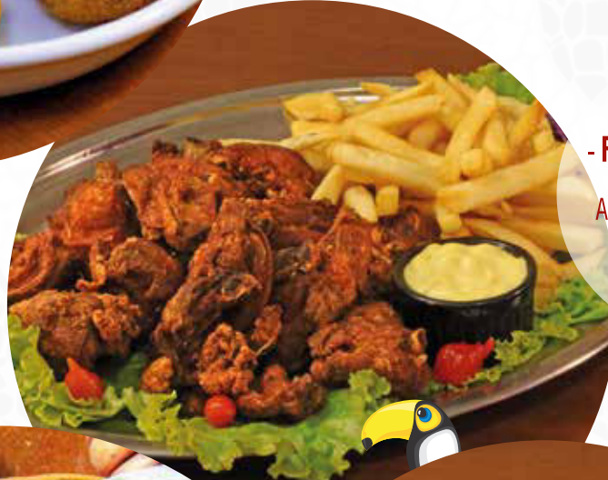
- Frango à Passarinho com Fritas Acompanha molho Dijon (1000g/ 300g) - R$ 69,90